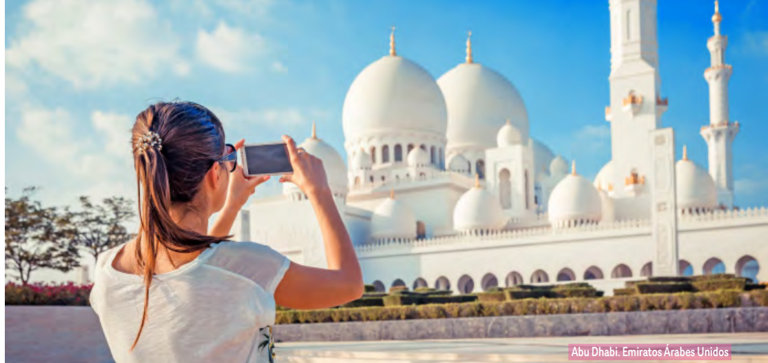
Abu Dhabi. Emiratos Árabes Unidos